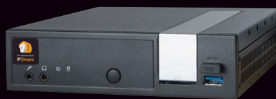
NVR(ネットワークビデオレコーダー)

ライブ表示とサーモグラフィ表示が 2分割で同時に表示されるので、 発熱者の特定が簡単です。