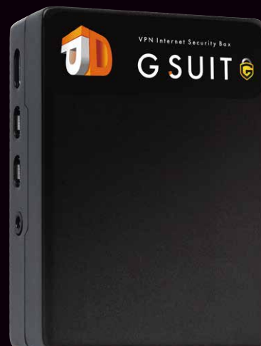
手のひらサイズで持ち運びも簡単 サイズ(mm):縦92×横67×高さ28 重さ:165g

高度な独自認証の後、端末同士で直接(P to P)接続が可能。 センター型VPNのサーバダウンの影響を受けず、従来のVPNにありがちな 「繋がらない」「つながりにくい」といった不満を解消します。